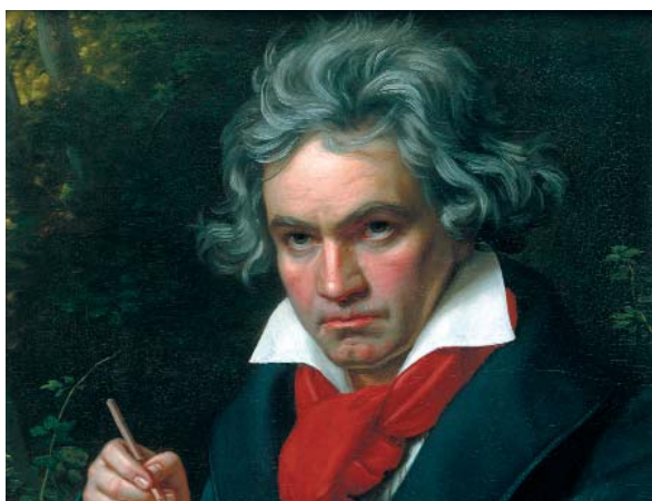
Ludwig van Beethoven.

Come spiega il Dr. Hubert Eiholzer, responsabile del Dipartimento di ricerca del Conservatorio e capo-progetto: "Intendiamo scoprire in che cosa consiste l'arte dell'interpretazione, ossia se esistono aspetti generalizzabili e stra-