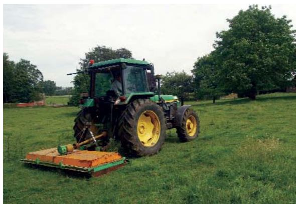
Un trattore nei campi.

Al progetto partecipa l'Istituto Dalle Molle di Studi sull'Intelligenza Artificiale (IDSIA, USI-SUPSI) che coordina il gruppo di lavoro composto da 7 istituti e 2 aziende che si occupano dello sviluppo di una piattaforma software. Come spiega il Dr. Andrea Emilio Rizzoli, ricercatore presso l'IDSIA: "L'obiettivo del progetto è quello di realizzare un sistema informatico integrato per lo sviluppo e la valutazione delle politiche agricole a livello europeo che si basi su un insieme di modelli matematici implementati ed eseguiti su calcolatori. Per fare ciò, è necessario effettuare analisi di tipo integrato, che prendano cioè in considerazione non soltanto