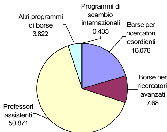
Sussidi del FNSRS per l'incoraggiamento delle persone 2003 (mio. frs.)

Accanto ai programmi presentati, il FNRS offre diversi strumenti più specifici: si tratta in particolare del programma Marie Heim Vögtlin, che sostiene delle ricercatrici che hanno dovuto interrompere la carriera scientifica per ragioni familiari; dei